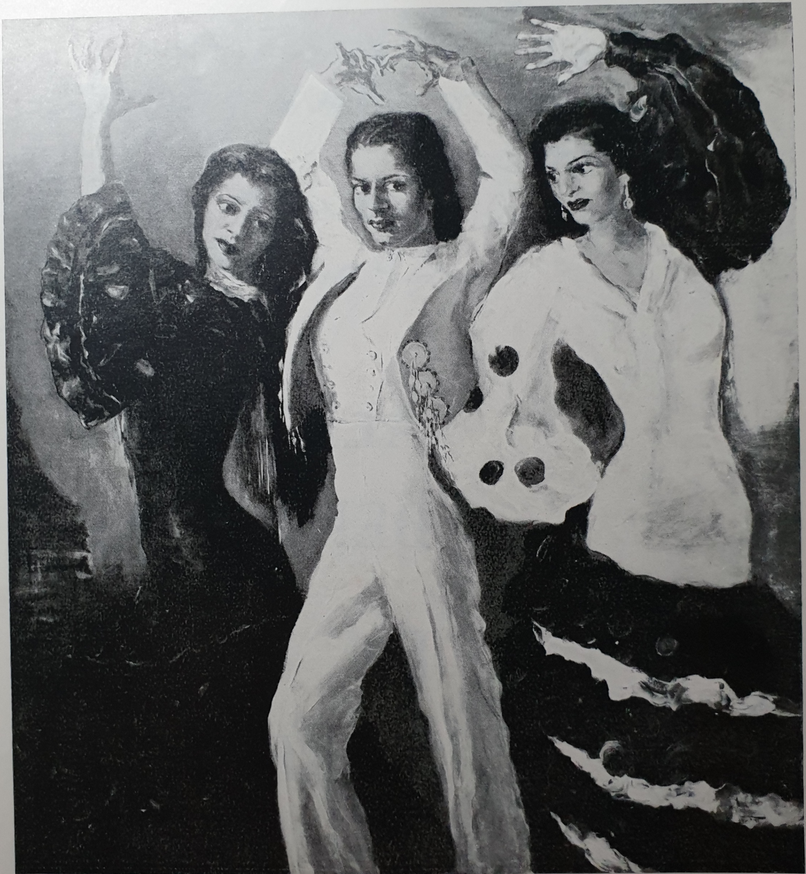
"CARMEN AMAYA y SUS HERMANAS", cuadro que figuró en la "Exposición del Arte de España de Seis Centurias", en Florida —Estados Unidos—