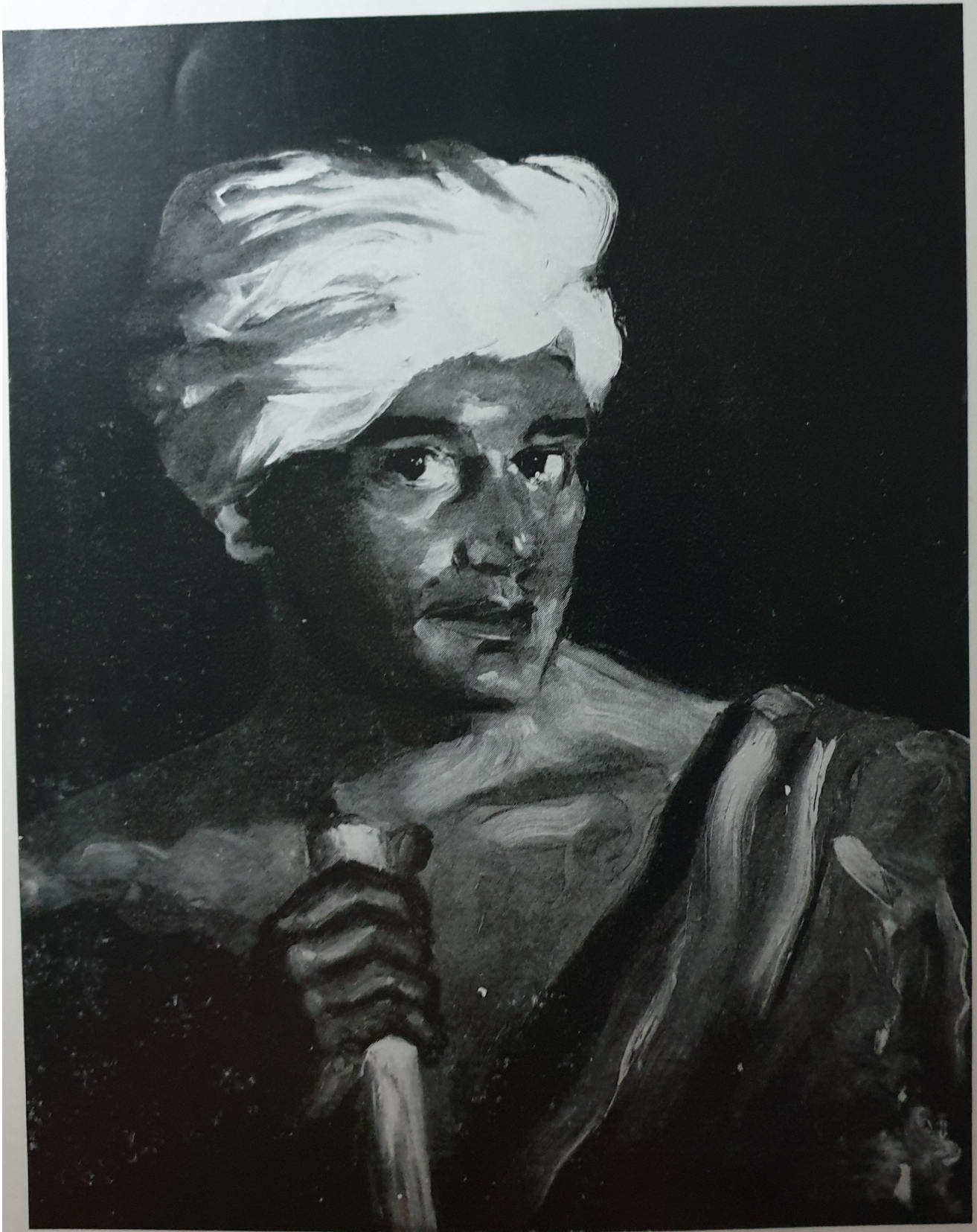
"El Moro" — Museo Nacional de La Habana —.