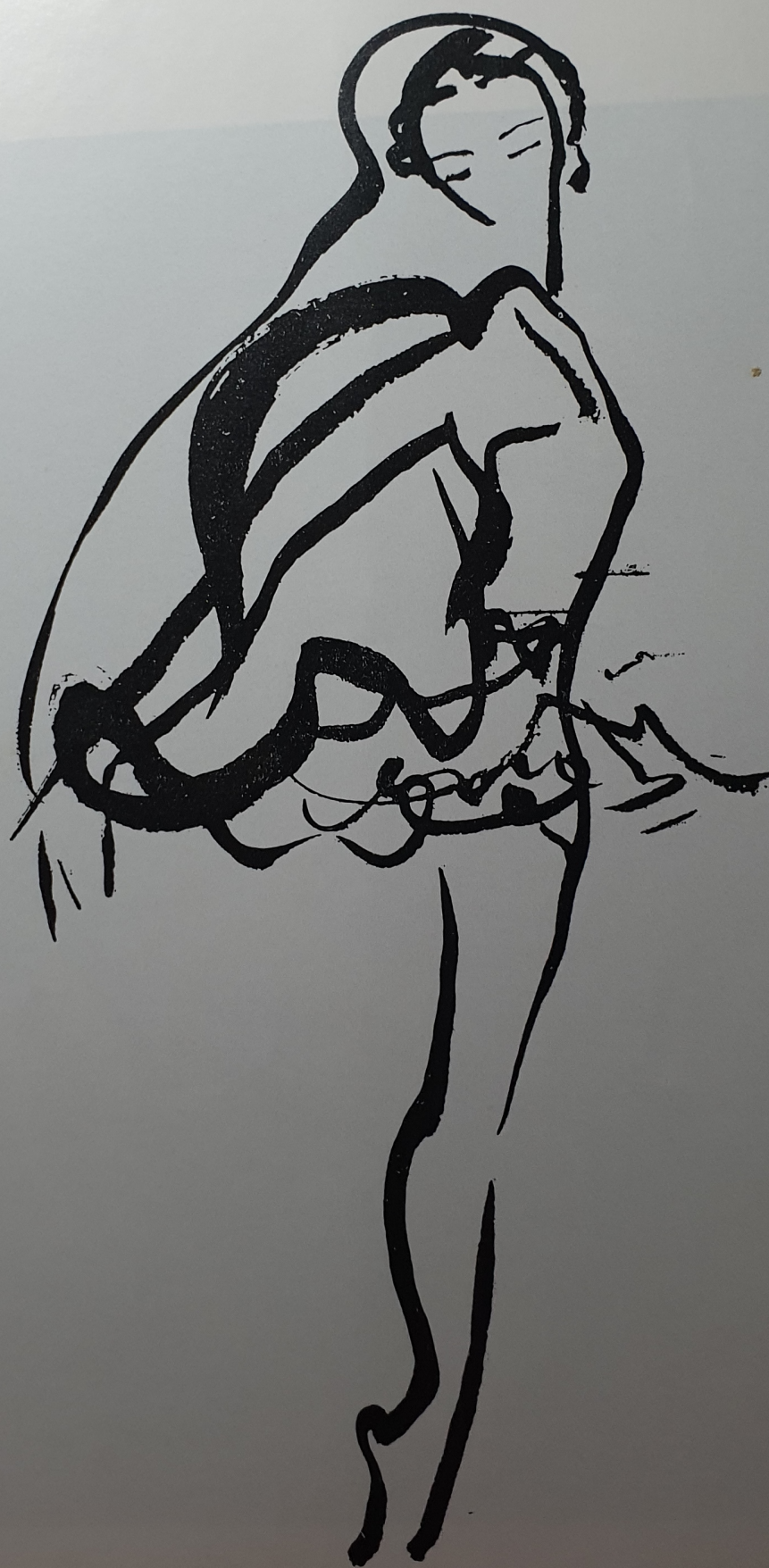
Galina Ulanova, en "La muerte del cisne".