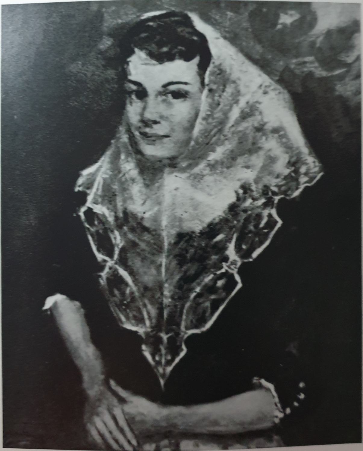
"Regazza di Majorca", — Musso de Roma —